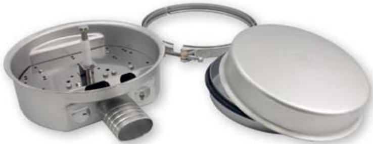
Skarvbox TS för fiberoptisk kabel

Skarvbox TS ingår i ett modulsystem av låsbara kapslingar tillverkade i syrafast rostfritt stål. Kännetecknande är stor flexibilitet, enkel hantering och täthet för både tryck och vacuum. Kapslingarna lämpar sig väl för krävande miljöer. Med torkmedel förblir boxen fuktfri även under extrema förhållanden.