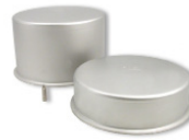
Förlängningsaxel och överdel