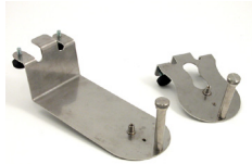
Kassetthållare vertikal och horisontell