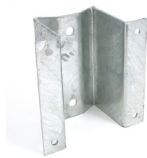
Stolpfäste för liggande box