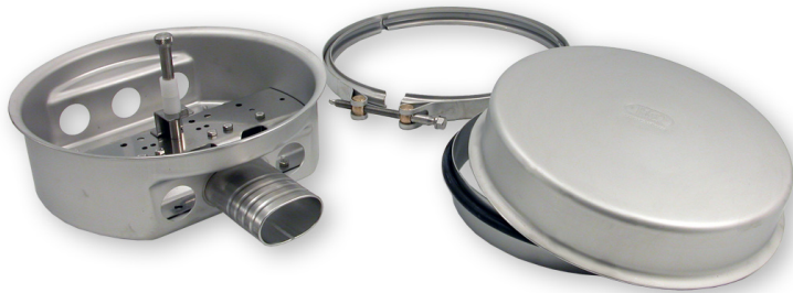
Skarvbox TSS med kabelgenomföring 4x10, 6x6 och 2x10mm

Skarvbox TSS ingår i ett modulsystem av låsbara kapslingar tillverkade i syrafast rostfritt stål. Kännetecknande är stor flexibilitet, enkel hantering och täthet för både tryck och vacuum.