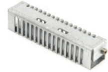
Hållare 48 mikrorör (7 mm) Art. nr. 11 478 422