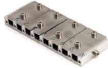
Multihållare för kabel, metall lock Art. nr. 11 478 410