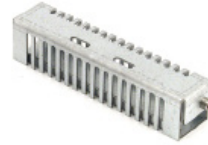
Hållare T20/80 64 mikrorör (4 mm) Art. nr. 11 478 418 (5 mm) Art. nr. 11 478 420