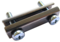
Dragavlastningskit 48 mm Art. nr. 11 478 048