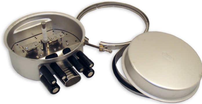
Skarvbox TSG för fiberoptisk kabel

Skarvbox TSG ingår i ett modulsystem av låsbara kapslingar tillverkade i syrafast rostfritt stål. Kännetecknande är stor flexibilitet, enkel hantering och täthet för både tryck och vacuum. Kapslingarna lämpar sig väl för krävande miljöer. Med torkmedel förblir boxen fuktfri även under extrema förhållanden.