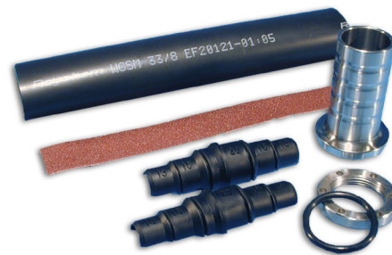
11 212 132 Kabelgenomföring sats 1x24 inkl adapterhylsa kabeldiameter 9 - 24 mm.