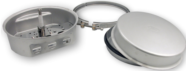
Skarvbox TUT för fiberoptisk kabel

Skarvbox TUT ingår i ett modulsystem av låsbara kapslingar tillverkade i syrafast rostfritt stål. Kännetecknande är stor flexibilitet, enkel hantering och täthet för både tryck och vacuum. Kapslingarna lämpar sig väl för krävande miljöer. Med torkmedel förblir boxen fuktfri även under extrema förhållanden.